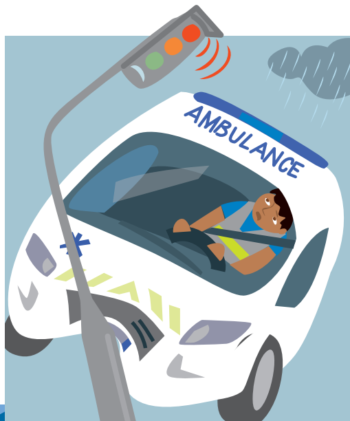
ACCIDENTS DE LA ROUTE