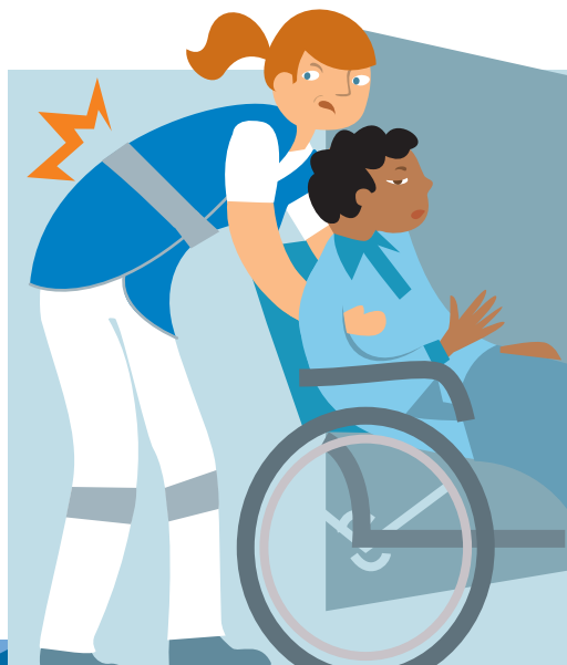
DOULEURS AU DOS