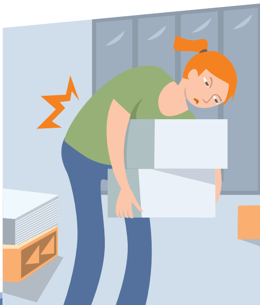
DOULEURS AU DOS